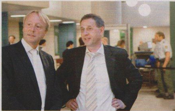
Verteidiger Neuhaus, Gorka: Wie viele stille Verlierer?

Das alte Unrecht, es frisst sich wie Säure durch seine Seele, es fesselt ihn an die Vergangenheit: „Die da oben lachen doch über das Würmle Wörz! Wie geht denn der Staat mit Polizisten um, die Akten manipulieren? Mit Staatsanwälten, die