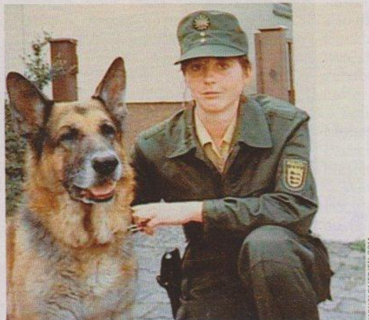
Opfer Andrea: Halb totgewürgt

wie der hessische Biologielehrer, der zehn Jahre lang gegen den Vorwurf kämpfte, ein Vergewaltiger zu sein, davon fünf in Haft. Oder die Berliner Arzthelferin, die 888 Tage lang unschuldig wegen Mordes und schwerer Brandstiftung im Gefängnis saß. Danach lebte die Frau von Hartz IV. Das Berliner Kammergericht verdonnerte sie dazu, einen Teil der Kosten für ein Gutachten, das ihre Unschuld bewies, selbst zu tragen: 13 067,98 Euro.